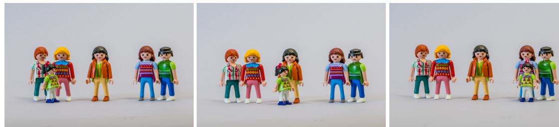
Der Weg des Kindes von der Herkunftsfamilie in die Adoptivfamilie wird von der Fachkraft begleitet. Dabei stehen die Interessen des Kindes im Mittelpunkt.

Die Fachkraft der Adoptionsvermittlungsstelle begleitet und berät die neue Familie während der Adoptionspflegezeit. Sie gibt nach deren Ablauf eine