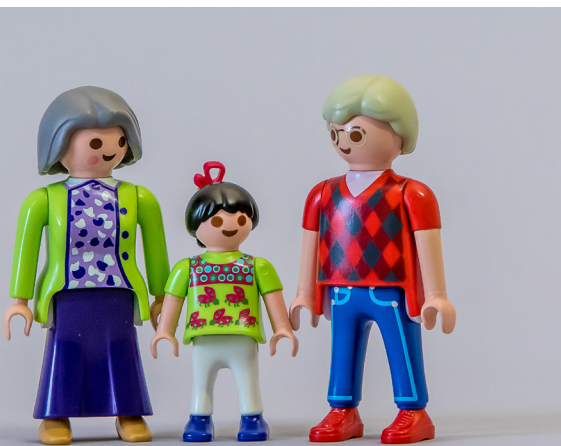
Die Vor- und Nachteile einer Verwandtenadoption sind sorgfältig gegeneinander abzuwägen.