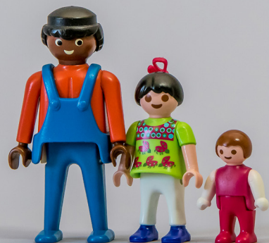
Bei Auslandsadoptionen werden vorrangig für ältere oder kranke Kinder Eltern im Ausland gesucht.

vielfältig. Die Kinder befinden sich in sozialen und wirtschaftlichen Notlagen und erhalten in ihrem Heimatland keine angemessene Unterstützung. Eine Auslandsadoption ist eine Hilfe im Einzelfall für ein Kind, das in seinem Heimatland weder adoptiert noch dauerhaft in einer Pflegefamilie leben kann. Dies hat zur Folge, dass vorrangig für ältere und/oder kranke Kinder Eltern im Ausland gesucht werden. Die Bedarfe solcher Kinder stellen an Adoptionsbewerberinnen und -bewerber erhöhte Anforderungen.