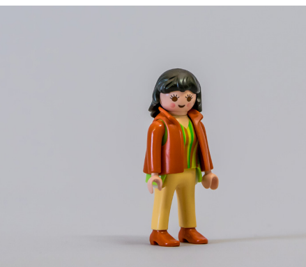
Die Fachkraft berät leibliche Eltern und kümmert sich um die Vorbereitung der zukünftigen Adoptiveltern.

Im Rahmen der nachgehenden Adoptionsbegleitung steht die Fachkraft auch nach dem gerichtlichen Adoptionsabschluss der Adoptivfamilie und/oder der Herkunftsfamilie auf Wunsch beratend zur Seite.