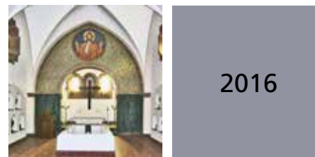
Denkmale unserer Regionen Deutschsprachige Gemeinschaft (Belgien) Eifelkreis Bitburg-Prüm (Deutschland) Saarland (Deutschland)

En 2016, pour la vingt-sixième fois consécutive, nos trois régions s'associent dans le cadre des Journées européennes du Patrimoine. Suivant la recommandation du Conseil de l'Europe, ce partenariat transfrontalier se propose de mettre en valeur un patrimoine commun. Les thèmes de cette année sont consacrés aux sujets « religion et philosophie » et « préserver en commun nos monuments historiques ». D'une part les lieux rare à visiter peuvent exciter nos imaginations et transmettent la dévotion et la conception du monde des temps anciens ou bien les monuments historiques préservés en commun sont à admirer. Notre projet des « Journées du patrimoine transfrontaliers » de longue date le montre aussi de façon exemplaire.