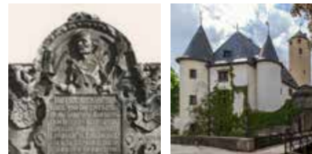
Patrimoine commun de nos régions Communauté Germanophone Belgique Eifelkreis Bitburg-Prüm (Allemagne) Saarland (Allemagne)