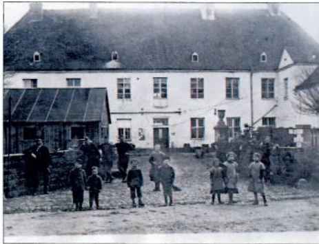
Hofseite um 1920, rechts neben der Eingangstür die Kreuzstockfenster des 17. Jahrhunderts.

durch das Datum 1734 auf der Takenplatte der großen Küche belegt. 1799 gelangt der Besitz durch Erbschaft an die Grafen de Saintignon, der letzte Graf lässt 1906 den Turm auf der Gartenseite errichten. Seit 1916 in wechselndem Privatbesitz wird das Haus nach 1950 grundlegend saniert und im Geschmack der Zeit ausgebaut. An den erneuerten westlichen Seitenflügel wurde ein achteckiger Turm angefügt, 1974 entstand an Stelle der drei östlichen Achsen ein eingeschossiger, angepasster Neubau im Landhausstil. Seit 2007 finden umfangreiche Sanierungs- und Instandsetzungsarbeiten statt, deren Ziel die Wiederherstellung der historischen Raumfolge und des Erscheinungsbildes des 17./18.