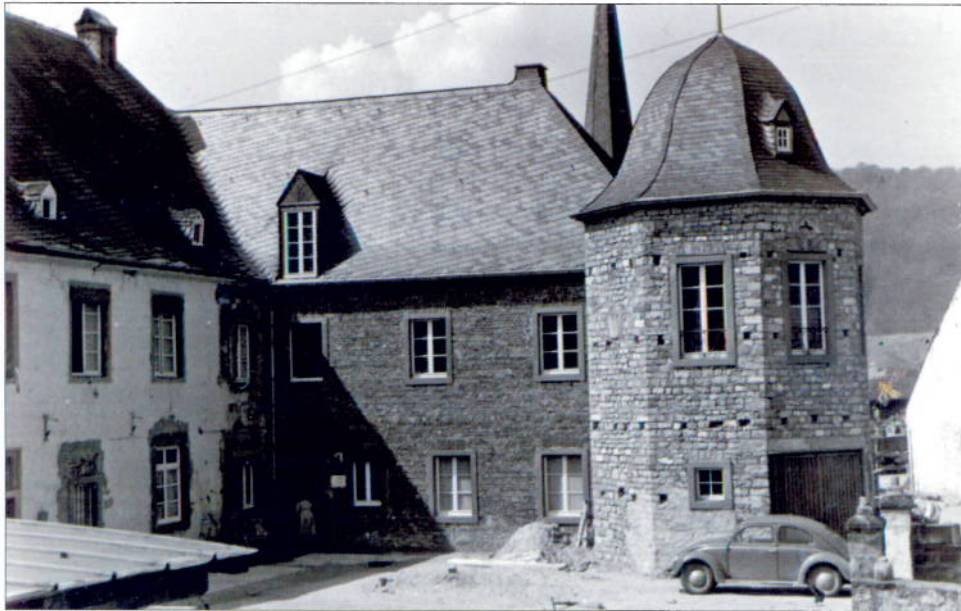
Erneuerter Westflügel mit angebautem Achteckturm um 1950

qui s'efforcent de faire réapparaître l'aspect et l'aménagement des 17 et 18 siècles. De nombreux éléments historiques sont retrouvés, par exemple la grande cuisine avec le fumoir porté par deux piliers, la taque et le four en pierre. Au rez-de-chaussée une grande salle (probablement