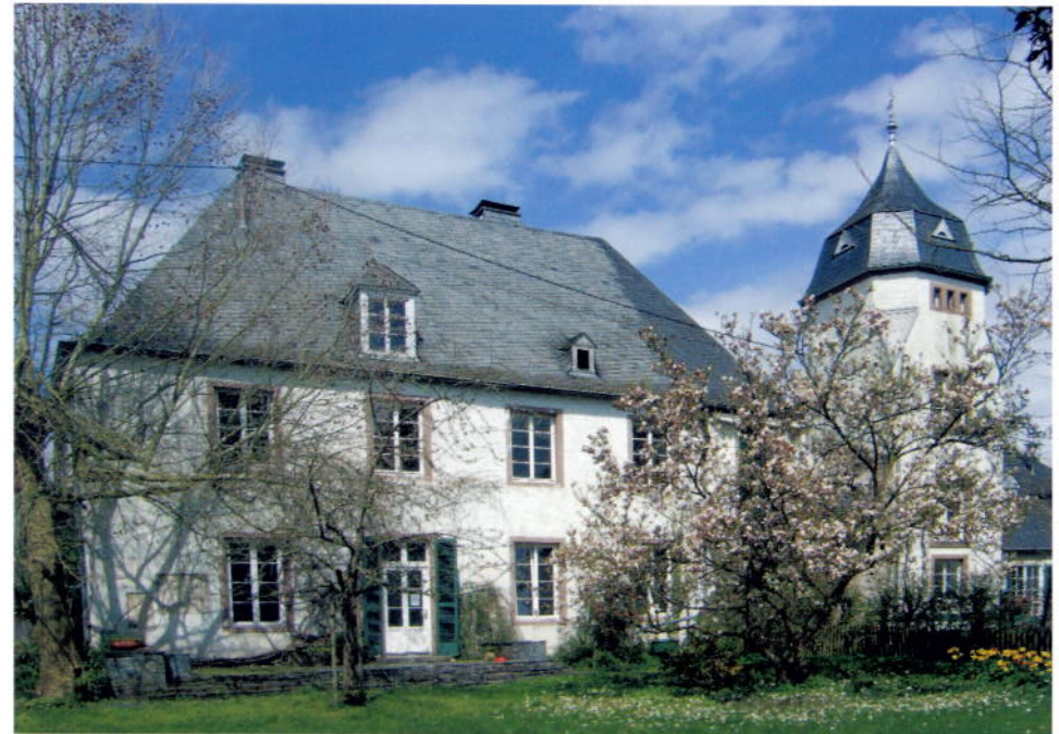
Gartenseite, rechts der Turm von 1906