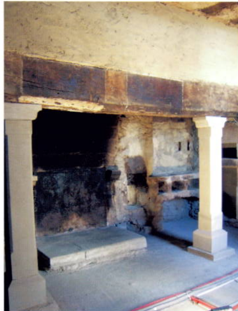
Küche mit großer Esse, Herd mit „Potager“ zum Wärmen und Backofen

durch das Datum 1734 auf der Takenplatte der großen Küche belegt. 1799 gelangt der Besitz durch Erbschaft an die Grafen de Saintignon, der letzte Graf lässt 1906 den Turm auf der Gartenseite errichten. Seit 1916 in wechselndem Privatbesitz wird das Haus nach 1950 grundlegend saniert und im Geschmack der Zeit ausgebaut. An den erneuerten westlichen Seitenflügel wurde ein achteckiger Turm angefügt, 1974 entstand an Stelle der drei östlichen Achsen ein eingeschossiger, angepasster Neubau im Landhausstil. Seit 2007 finden umfangreiche Sanierungs- und Instandsetzungsarbeiten statt, deren Ziel die Wiederherstellung der historischen Raumfolge und des Erscheinungsbildes des 17./18.