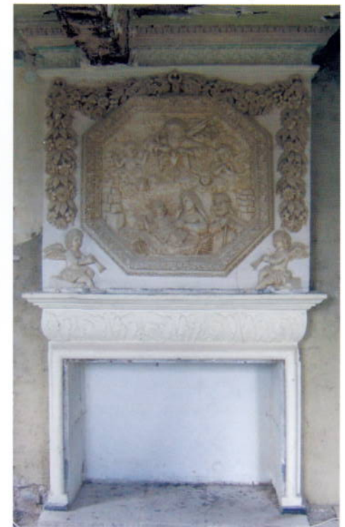
Prachtvoller Kaminaufsatz: Geburt Jesu, mit Gott Vater, dem Hl. Geist und jubelnden Engeln.