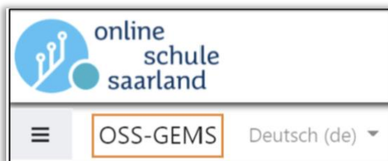
Abbildung 1: Aktueller (Schul-) Bereich