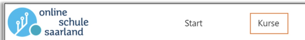
Abbildung 2: Wechsel zum korrekten (Schul-) Bereich