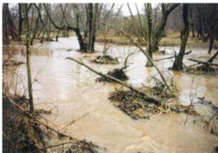
Abb. 4: Die bei Hochwasser überflutete Aue ist Teil des Gewässerökosystems.

Als fachliche Grundlage für die Ableitung des gewässertypenspezifischen Leitbildes steht der Gewässertypenatlas des Saarlandes (Ministerium für Umwelt, 1998) zur Verfügung.