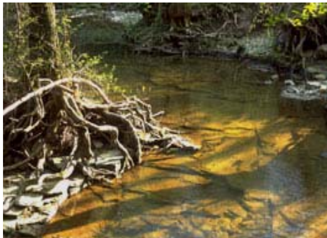
Abb. 10: Naturnahe Sohlstrukturen in einem sandführenden Gewässer

Bei einem gewässermorphologisch dynamischen Gewässer werden sich die standorttypischen Untergrundverhältnissen selbständig entwickeln. Die hydraulischen Bedingungen bestimmen den Feststofftransport und damit auch die gewässertypische Sohlausbildung mit entsprechender Substratsortierung und Ausbildung der kleinräumigen Strukturelemente (Sand, Kies u.ä.).