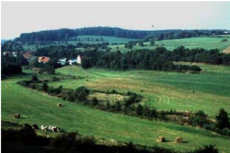
Abb. 20: Die umgestaltete Oстераue bei St. Wendel-Osterbrücken

Die Verbesserung der Gewässergüte stellt sich dann - unter Berücksichtigung des Faktors Zeit - von alleine ein. Wichtig ist in jedem Fall, Maßnahmen zur naturnahen Gewässergestaltung und –entwicklung erst durchzuführen, wenn die Abwasserreinigung („Grundausstattung“) im Einzugsgebiet des Gewässers durchgeführt ist, das Gewässer also mindestens eine Gewässergüte von II (bzw. der „gute Zustand“ nach der EG-Wasserrahmenrichtlinie) aufweist bzw. dieses Ziel innerhalb von 4 Jahren zu erwarten ist.