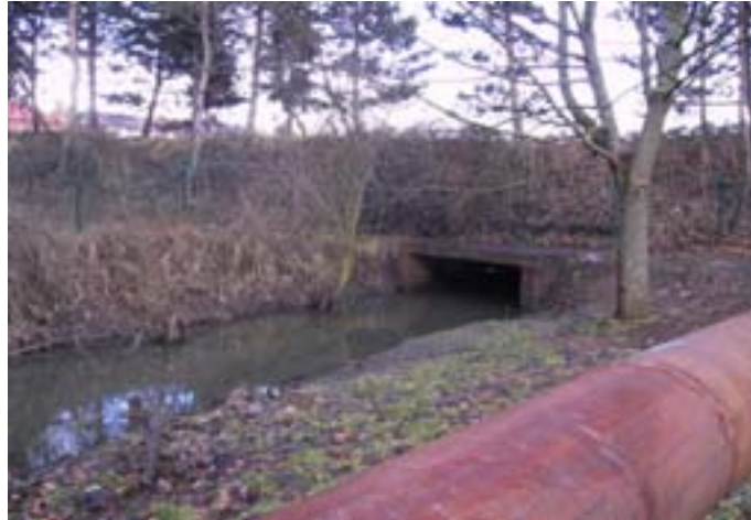
Abb. 11: Verrohrungen stellen häufig unüberwindbare Hindernisse für wassergebundene Tierarten dar.

Querbauwerke im Gewässer führen in der Regel dazu, die Passierbarkeit für Fische und andere wandernde Gewässerorganismen und damit die biologische Durchgängigkeit zu verhindern.