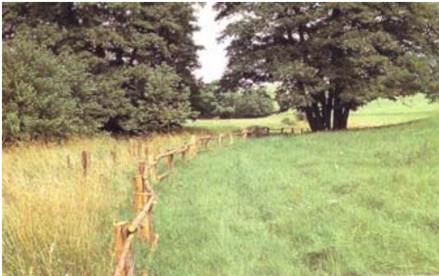
Abb. 5: Ausgegrenzter Gewässerrandstreifen als Voraussetzung für eine naturnahe Entwicklung des Gewässers („Entwicklungskorridor“) (Bild: Volker Wild)

Um der Eigendynamik eines Fließgewässers eigentumsrechtlich konfliktarme Entwicklungsmöglichkeiten einzuräumen, ist der Grunderwerb zur Vergrößerung des Gewässerentwicklungskorridors die entscheidende Voraussetzung. Aufgrund der hohen ökologischen Effizienz der Eigenentwicklung von Gewässern sind daher Aktivitäten zum Grunderwerb i.d.R. allen baulichen Maßnahmen zur Entwicklung naturnaher Gewässer vorzuziehen. Als – aus fachlicher Sicht erforderlicher – Minimalwert für die Breite des dazu notwendigen Entwicklungskorridors sollte auf jeder Seite des Gewässers (ab Böschungsoberkante) das Fünffache der Spiegelbreite (bezogen auf mittleren Wasserstand) vorgesehen werden.