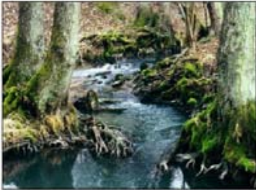
Abb. 2: Naturnahe Sohl- und Uferausbildung am Hetschenbach bei Gersheim