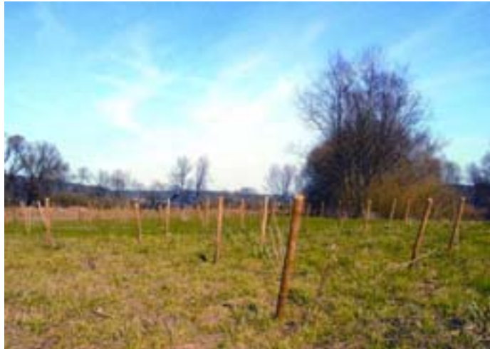
Abb. 18: Wiederpflanzung von Auenwald als Beitrag zur Revitalisierung der Auen