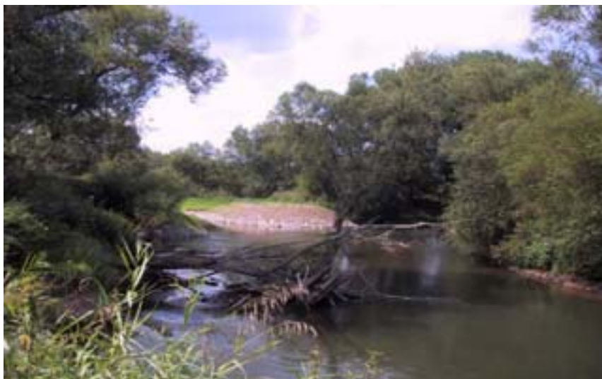
Abb. 17: Altarme und Altwasser sind wichtige Feucht-Lebensräume

Dieser natürliche Prozess bedarf keiner weiteren Unterstützung durch etwaige Renaturierungsmaßnahmen. Vielmehr sollten die Voraussetzungen dafür geschaffen werden, dass das Fließgewässer aufgrund seiner Eigendynamik weitere Altarme schaffen kann.