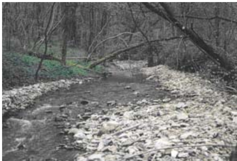
Abb. 6: Referenzgewässer Metzgerbach bei Hemmersdorf – natürliches Vorbild eines Kerbtalbaches im Mittleren Saartal

Konkrete Maßnahmen zur naturnahen Gewässergestaltung erfordern die Orientierung an den jeweiligen gewässertypenspezifischen und naturraumtypischen Verhältnissen. Das betrifft sowohl die Abflussdynamik als auch die Dynamik derjenigen Prozesse, die zur Erosion und Akkumulation im Sohlen- und Uferbereich des Gewässers führen. Neben den morphologischen sind auch biozönotische Aspekte (= der Lebensgemeinschaften) zu berücksichtigen.