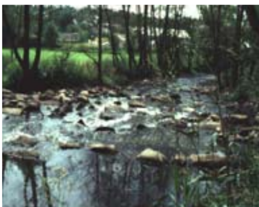
Abb. 12: Die vor einem Wehrkörper angelegte Raurampe macht das Gewässer wieder durchwanderbar, z.B. für Fische

Zur Beseitigung dieser Wanderhindernisse sollte anstelle des Baues von Fischpässen geprüft werden, inwieweit Sohlabstürze und Wehre nicht in naturnahe Fischwanderhilfen (z.B. Raurampen, Umleitungsbäche und Sohlgleiten) umgebaut werden könnten, die in beide Richtungen passierbar sind.