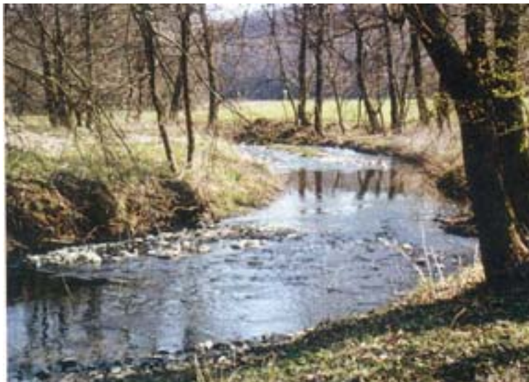
Abb. 8: Der Wechsel von schnell und langsam fließenden Bereichen ist typisch für den Längsverlauf von Gewässern (Bild: Christof Kinsinger)

Flächen keine langen Fließstrecken zur Verringerung der Schleppspannung geschaffen werden, so sollte bei Gefahr fortschreitender Sohlerosion das überschüssige Fließgefälle durch geeignete Bauwerke mit Energieumwandlung (Sohlrampen) kompensiert werden. Der ungehinderte Fischwechsel und der Wechsel des Makrozoobenthon ist zu gewährleisten (= biologische Durchgängigkeit). Glatte Absturzkanten sind zu vermeiden.