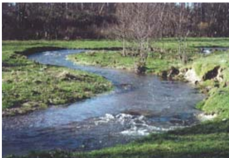
Abb. 9: Der Hölzbach bei Losheim - Beispiel für die natürliche Entwicklung des Querprofils eines Gewässerlaufes vom Typus „Auetalgewässer“

Dahingegen sind Maßnahmen, die der naturgemäßen Querprofilentwicklung dienen (Einbau von Totholz, Profilaufweitungen, Störelemente u.ä.) zu berücksichtigen.