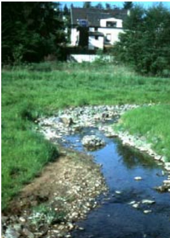
Abb. 7: Beispiel einer Umgestaltung: die Linienführung wurde grob vorgegeben und nicht massiv gesichert. Das Gewässer hat die Möglichkeit Gewässerbett und Längsverlauf selbst zu bestimmen.

Durch gezielte Einzelmaßnahmen in Verbindung mit Zurverfügungstellung eines "Entwicklungskorridors" soll dem Gewässer eine möglichst weitgehende selbständige Entwicklung seines neuen Verlaufs ermöglicht werden ("Lassen vor machen").