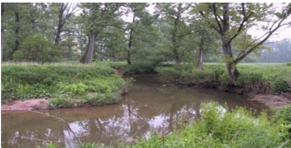
Blies bei Wiebelskirchen