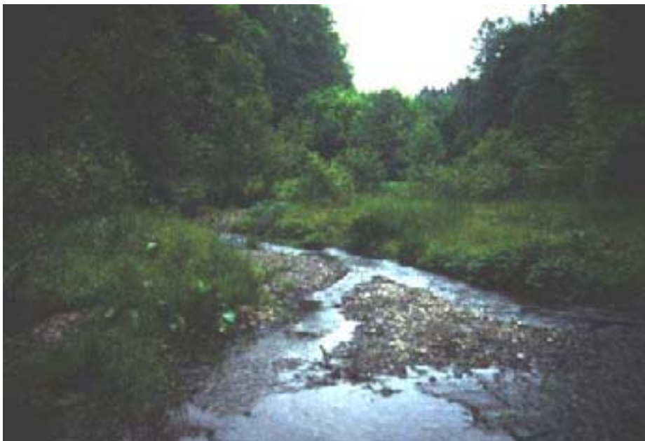
Abb. 1: Beispiel eines naturbelassenen Gewässers -Netzbach bei Fischbach

Die daraus abgeleiteten, leitbildorientierten Maßnahmen zur Entwicklung naturnaher Gewässer lassen sich folgendermaßen differenzieren: