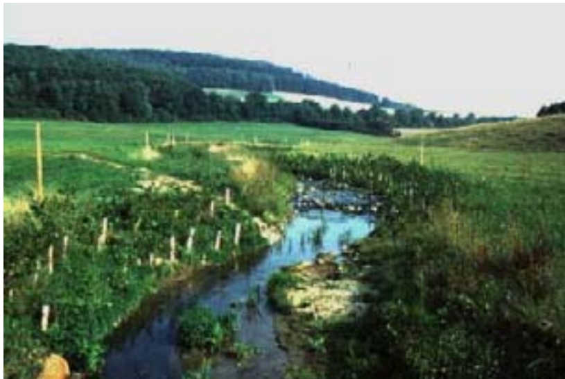
Abb. 19: Umgestaltung der Oster bei St. Wendel und Freisen

Die naturnahe Gewässergestaltung und –entwicklung („Renaturierung“) verbessert die Gewässerstrukturgüte des Gewässers und damit die Lebensbedingungen für wasser-gebundene Organismen und Lebensgemeinschaften. Die Abhängigkeit von morphologischer Vielfalt und Artenzahl bzw. Häufigkeit von Wasserorganismen ist fachlich belegt. Wasserorganismen wie Bakterien, Pilze, Algen, Insektenlarven, Kleinkrebse, Fische u.a. bewirken den Abbau organischer Stoffe und sind damit Träger der Selbstreinigung des Gewässers.