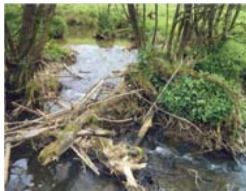
Abb. 3: „Totholz“ im Gewässer als Beitrag zur Strukturanreicherung