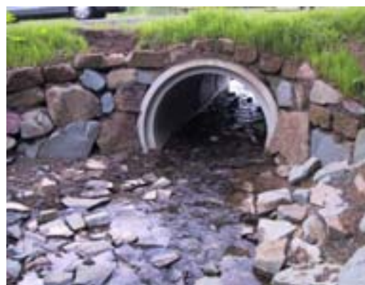
Abb. 13: Ist eine Rohrdurchlass ausreichend groß und verfügt über eine Sedimentauflage sowie einen durchgehenden Wasserspiegel, können Fische und andere wassergebundene Organismen das Bauwerk durchwandern.