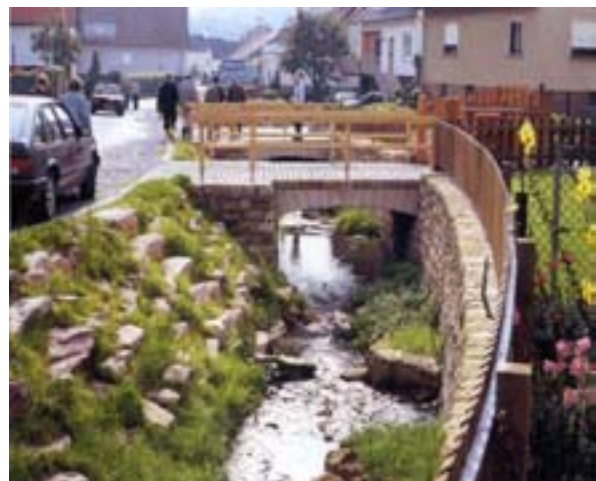
Abb. 15 u. 16: Bezüglich anzustrebender Leitbilder für Gewässer ist zwischen der freien Landschaft und dem besiedelten Bereich zu unterscheiden