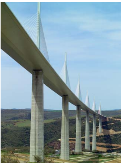
Stahl der Dillinger Hütte für das Viaduc de Millau, die höchste Brücke der Welt.