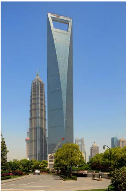
Stahl der Dillinger Hütte für das World Financial Center in Shanghai, © Mori Building.

ne ist ein wichtiger Erfolgsfaktor. Die Wissenschaftler wissen, wie sie die Anforderungen der Kunden an das Material metallurgisch umsetzen müssen, damit Stahl zum Beispiel arktischer Kälte trotzen oder dem Druck von Wasser Hunderte von Metern unter dem Meeresspiegel standhalten kann. Mit Hilfe der Computersimulation suchen sie nach der richtigen Zusammensetzung von Eisen und Legierung, um die gewünschten Materialeigenschaften zu erhalten. Ist die richtige Mischung gefunden und das geeignete Herstellungsverfahren ausgewählt, beginnt die Produktion. Danach testen die Entwickler die Leistungsfähigkeit der Bleche unter praxisnahen Bedingungen. Oftmals werden dabei die vom Kunden geforderten Leistungsansprüche sogar übertroffen. Dies macht die saarländische Marke „Dillinger Hütte“ auf der ganzen Welt zu einem Begriff für besondere Qualität und Zuverlässigkeit.