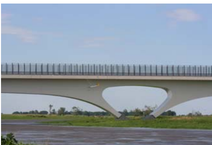
Stahl der Dillinger Hütte für die Elbebrücke, die 2010 mit dem Deutschen Brückenbaupreis ausgezeichnet wurde.

Herausgeber: Ministerium für Wirtschaft und Wissenschaft Franz-Josef-Röder-Straße 17 D-66119 Saarbrücken