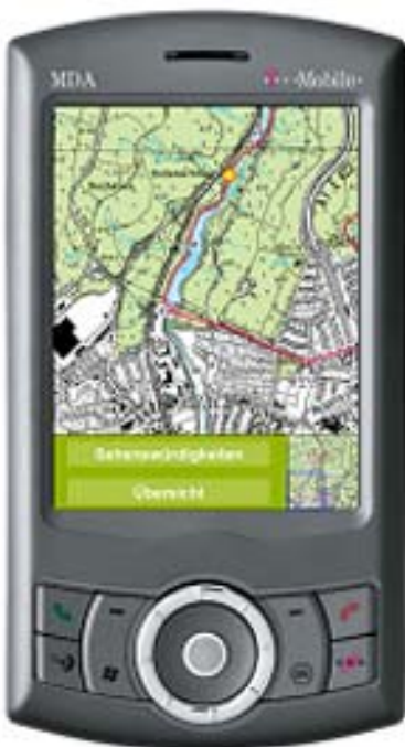
„Moin“ – das mobile Informationssystem für den Wandertourismus im Saarland