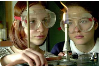
Engagement für Jugend, Technik und Berufsorientierung