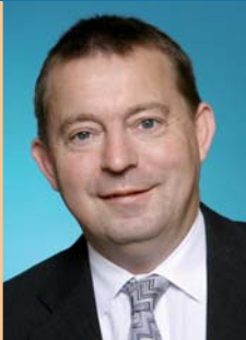
Stefan Mörsdorf, Minister für Umwelt des Saarlandes

Noch mehr Informationen zum Thema „Lärm in Schulen“ finden Sie übrigens auch auf dem hierzu eingerichteten Internetportal www.saarland.de/29141.htm .