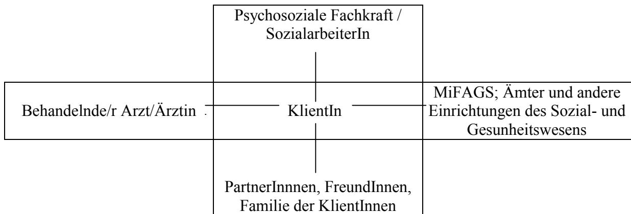
Abb. 2. Praxismodell des klientInnenorientierten Case Managements in den beiden PBS-Clearingstellen Saarbrücken und Neunkirchen

Das PBS-Angebot in den Clearingstellen umfasst außerdem, je nach individueller Problemsituation und Hilfenachfrage, kurz- mittel- und langfristig angelegte Betreuungs- und Hilfeleistungen . Auch dieses Kriterium des Case Managements ist nach den Ergebnissen des Bundesmodellprojekts „nachgehende Sozialarbeit“ von elementarer Bedeutung für die Effizienz der Hilfsmaßnahme. Es betont ausdrücklich die Notwendigkeit des Angebots einer unter Umständen auch mehrere Jahre währenden Betreuung und verdeutlicht die Wichtigkeit der längerfristigen Fortführung des PBS-Projekts, auch nach Beendigung des Erprobungsvorhabens.