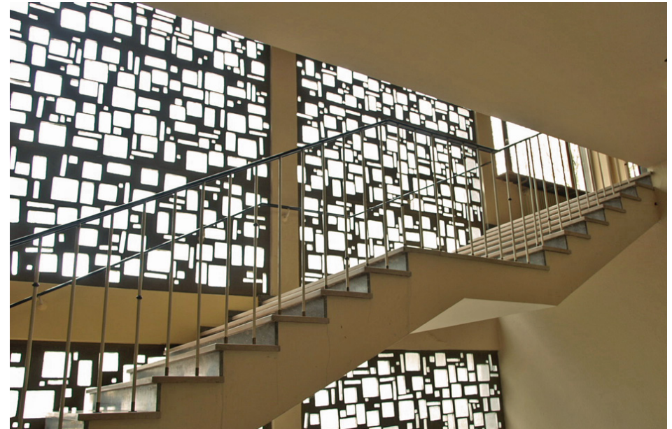
Treppenhaus Foyer, 2009

Das Äußere wurde in den 1970-1990er Jahre bereits in auffälligen Bereichen modernisiert. So erneuerte man den Haupteingang mitsamt dem Treppenaufgang. Das Bühnenhaus büßte seine fein gerasterte, keramische Oberflächengestaltung und seine Fenster zugunsten eines Vollwärmeschutzes mit einheitlichem Verputz ein. 1983-1984 entstand die Penthousewohnung im Eckhochhaus nach einem