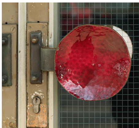
Türknauf am Foyereingang, 2009

Der vierteilige Baukomplex entstand in Stahlskelettbauweise, wobei das sechsgeschossige Eckhochhaus eine Gelenkfunktion wahrnimmt. Ursprünglich dienten die mittleren Etagen zu Wohnzwecken. Im Souterrain befindet sich der Kassenhalentrakt, im Erdgeschoss der Zugang zum Festsaalbereich. Dieser schließt sich mit leicht gebogener Rasterfassade entlang