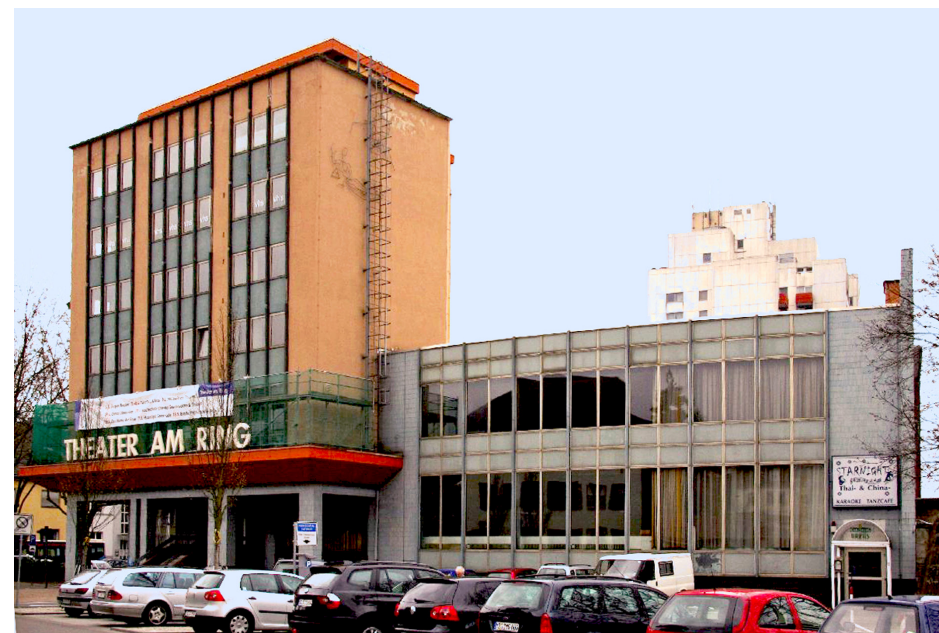
Theater am Ring, 2008

Das Theater am Ring entstand nach der Wiedereingliederung des Saarlandes in die Bundesrepublik Deutschland 1957-1960 nach Entwürfen des Düsseldorfer Architekten Hanns Rüttgers. Bauherr des außerhalb der Vauban'schen Kernstadt an der Ecke Lothringer Straße/ Kaiser-Friedrich-Ring errichteten Veranstaltungszentrums war der Kinobetreiber und Kaufmann Ernst Gill. Als Mitnutzer engagierte sich die Stadt Saarlouis durch Übernahme der Kosten für das Bühnenhaus. Saarlouis erhielt auf diese Weise ein großes kombiniertes Film- und Bühnentheater für 800