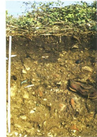
Pararendzina aus Bodenaushub und Müll