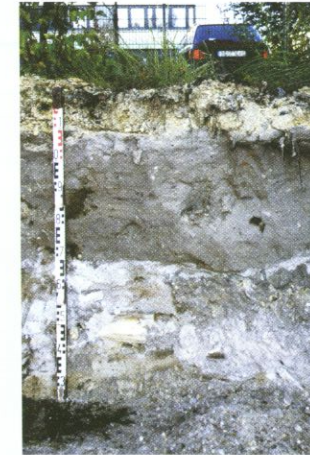
Boden über Trümmerschutt in Berlin

Ein Stadtboden kann spannende Geschichten erzählen. Jede Epoche der Siedlungsgeschichte hinterlässt ihre Spuren. So können Stadtböden tausend Jahre alten Bauschutt oder Reste mittelalterlicher Stadtbrände enthalten. In vielen städtischen Böden ist auch Trümmerschutt der zwei Weltkriege zu finden. Bombenfunde sind nicht selten. Begrabene Siedlungsstrukturen, alter Müll sowie uralte Grabstätten sind Zeugnisse aus oft weit zurückliegenden Zeiten. Sie geben Siedlungsforschern und Archäologen Rückschlüsse auf das Leben unserer Vorfahren. Auch Gewerbe, Bergbau und Industrie hinterlassen ihre Spuren in den Böden. In Zeiten unregelmäßiger Abfallentsorgung wurden manche Böden so stark belastet, dass ihre Filter- und Ausgleichsfunktionen versagten. Diese Flächen müssen heute aufwendig saniert werden.