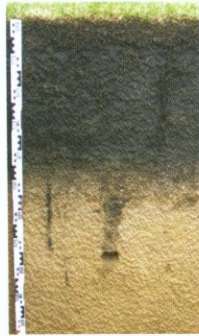
Schwarzerde der Bördelandschaften

Nutzungen wie Gewerbe, Industrie, Straßen, Wohnen, Gärten, Grünanlagen oder Brache beeinflussen die Stadtbodenentwicklung in sehr charakteristischer Weise: Böden in Gärten und Parkanlagen zeigen oft einen naturähnlichen Aufbau mit einem Humushorizont an der Oberfläche, dagegen sind Böden unter Straßen technisch stark verändert und durch eine Fahrbahndecke oben versiegelt. Dieses Mosaik aus Böden mit natürlicher Entwicklung, solchen aus umgelagerten Bestandteilen und welchen aus Bau- oder Trümmerschutt, Müll, Schlacken und Schlämmen ist typisch für Stadtlandschaften.