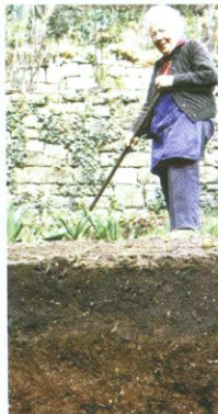
Hausgarten in Stuttgart