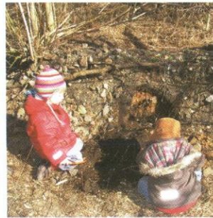
Auf Regenwurmsuche