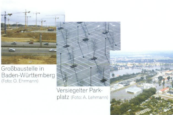
Großbaustelle in Baden-Württemberg