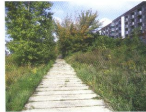
Grüne Stadtbrache in Berlin

Die Böden der Städte und deren Randbereiche sind mit ihren teilweise extremen Eigenschaften oft artenreiche Lebensräume. Vielfach sind sie sogar Rückzugsräume für seltene Tier- und Pflanzenarten. Die wichtigste Funktion von Stadtböden: sie sind Baugrund für Wohnhäuser, Kirchen, Kaufhäuser, Schulen, Theater und vieles mehr. Zwischen diesen Gebäuden tragen Böden unsere Straßen, Plätze, Sportstätten genauso wie Friedhöfe, Bahngleise und Kleingärten. Unzählige Ver- und Entsorgungsstränge durchziehen die Böden unserer Städte und sichern unser tägliches Leben.