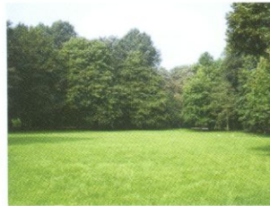
Die grüne Lunge in Essen - der Stadtpark

Stadtböden erfüllen sehr viele Funktionen. Die meisten sind nicht auf den ersten Blick erkennbar. Am stärksten nehmen Stadtbewohner Böden wohl in Parks, Gärten und auf Grünflächen wahr. Doch hier sind Böden nicht nur Grundlage für Freizeitgestaltung und Erholung, sondern auch Lebensgrundlage für Tiere und Pflanzen. Zudem sorgen sie zusammen mit den Pflanzen für ein ausgeglichenes Stadtklima - im Sommer wie im Winter. Sie sind die grünen Lungen der Städte. Ohne Böden gäbe es sie nicht!