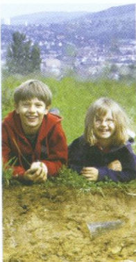
Stadtkinder brauchen Grünflächen

Die Möglichkeiten, Böden in Städten selbst zu erkunden und zu erleben, sind vielfältig. Sie sind überall anzutreffen: auf Spielplätzen, in Schulgärten, Parks, Kleingartenanlagen, Botanischen und Zoologischen Gärten; aber auch auf Fahrradwegen am Stadtrand, auf Brachflächen und an Baugruben. Seien Sie neugierig und schärfen Sie Ihren Blick. Es lohnt sich. Stadtböden haben viel zu erzählen.