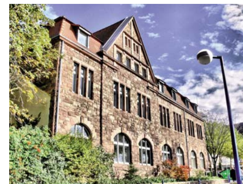
VHS-Weiterbildungszentrum in der De-Lenoncourt-Straße 5

der Weiterbildung“. Kerngedanke dieses Qualitätstests ist, dass der Kursteilnehmerinnen und Kursteilnehmer im Mittelpunkt der Qualitätsbemühungen stehen. Die VHS Dillingen versteht sich dabei als lernende Einrichtung, für die Qualitätsentwicklung und -verbesserung zu einer dauerhaften Aufgabe geworden ist. 2009 steht die Re-Zertifizierung an.