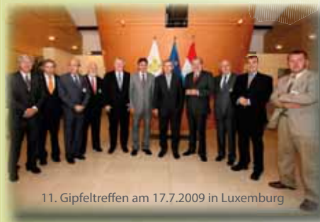
11. Gipfeltreffen am 17.7.2009 in Luxemburg

Die Großregion meldet sich zu europäischen Themen zu Wort. Sie bringt sich durch Stellungnahmen aus Sicht der Grenzregionen ein. Auf Initiative des saarländischen Ministerpräsidenten Peter Müller wurde die „ Interregionale Gruppe “ im europäischen Ausschuss der Regionen (AdR) gegründet. Ihre Aktivitäten und Stellungnahmen werden in Brüssel und in Europa beachtet .