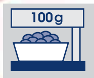
Messvorgang bei einer Waage mit Taraeinrichtung