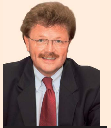
Karl Rauber, Minister für Bundes- und Europaangelegenheiten und Vorsitzender der Lenkungsgruppe

Das Saarland hat Ende Januar 2009 eine Lenkungsgruppe eingerichtet, der die Zuschussentscheidung an die einzelnen Kommunen obliegt. Die Leitung dieser Lenkungsgruppe, der alle Staatssekretärinnen und Staatssekretäre der Ressorts angehören, hat der Minister für Bundes- und Europaangelegenheiten und Chef der Staatskanzlei übernommen. Zur Lenkungsgruppe gehören auch die Vertreter der kommunalen saarländischen Spitzenverbände.