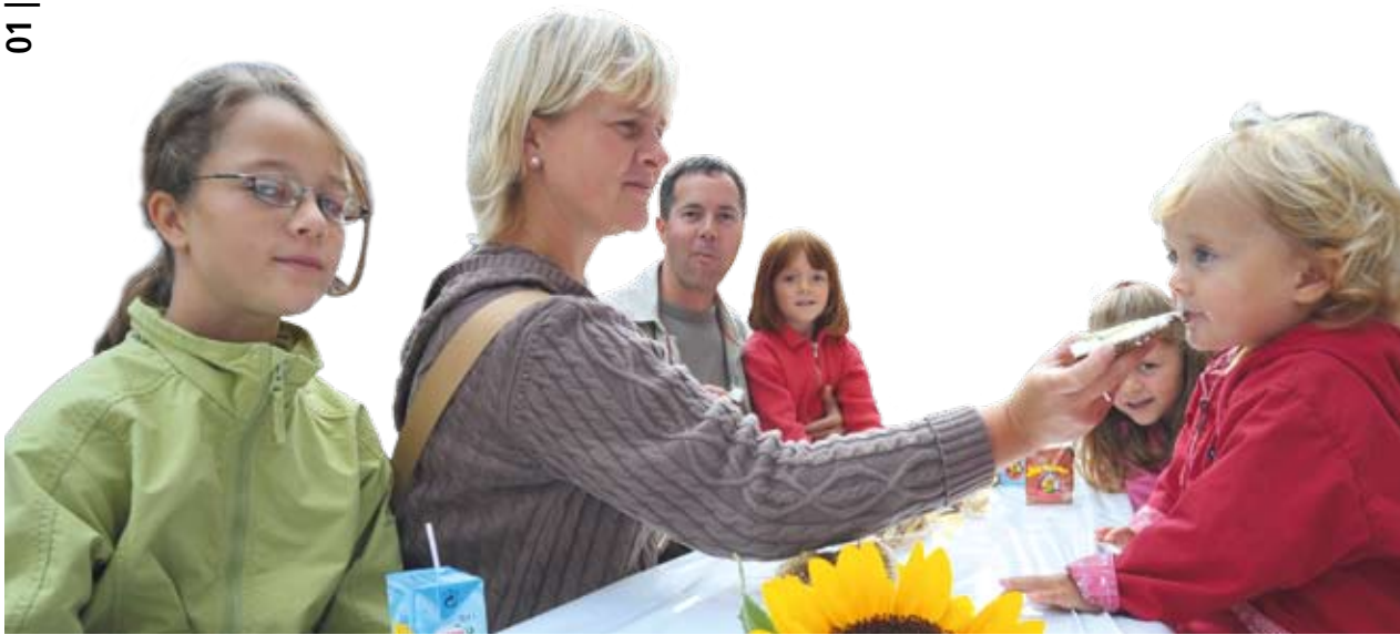
Gesundes Frühstück beim 1. Familientag in Dillingen.

Am Samstag, dem 11. Juli 2009, erwartet die Saarländerinnen und Saarländer aller Generationen von 10 bis 23 Uhr ein ereignisreicher Tag in Völklingen. Nach dem tollen Auftakt 2008 in Dillingen findet der Saarländische Familientag nun zum zweiten Mal statt. Er wird von der Landesregierung ausgerichtet - unterstützt durch die Stadt Völklingen.