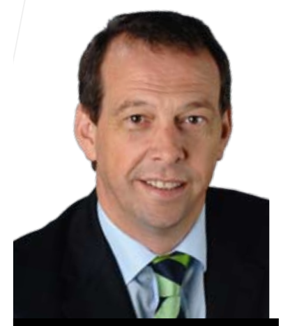
Minister für Inneres und Sport

„Durch die Föderalismusreform I haben die Länder im Beamtenrecht nicht nur formell neue Zuständigkeiten bekommen, sondern sie haben darüber hinaus echte neue Handlungs- und Gestaltungsspielräume gewonnen. Übergeordnetes Ziel bei der Umsetzung der Föderalismusreform im Beamtenrecht ist es daher, diese Gestaltungsspielräume zu nutzen und auszufüllen. Dabei geht es - auch unter Berücksichtigung unserer finanziellen Möglichkeiten - um mehrere Aspekte, wie beispielsweise die Aufrechterhaltung und den Ausbau des Leistungsprinzips sowie die Sicherung des hohen Qualifikationsniveaus der Beamtinnen und Beamten, die Anpassung des Beamtenrechts an die Erfordernisse der Zukunft, d.h. insbesondere die Berücksichtigung der sich verändernden Rahmenbedingungen in der Bildungslandschaft und des Erfordernisses lebenslangen Lernens, die Modernisierung und Flexibilisierung des Beamtenrechts unter Berücksichtigung aktueller und künftiger Personalbedarfsaspekte, die Erhaltung der (auch länderübergreifenden) Mobilität, d.h. wir dürfen uns nicht von der Rechts-