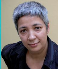
Seyran Ateş (Frauenrechtlerin, Autorin)