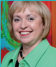
Prof. Dr. Maria Böhmer (Staatsministerin beim Bundeskanzleramt und Beauftragte der Bundesregierung für Migration, Flüchtlinge und Integration)